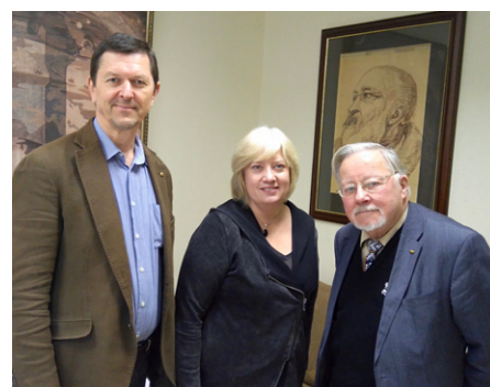
Susitikimas su prof. Vytautu Landsbergiu.