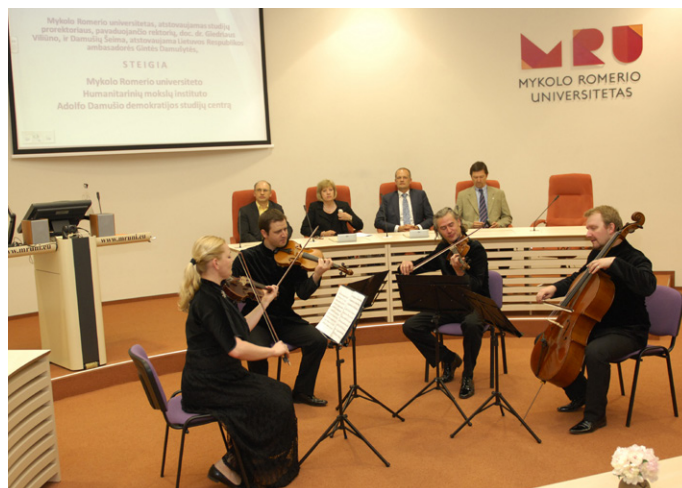
Centro steigimo akimirka.