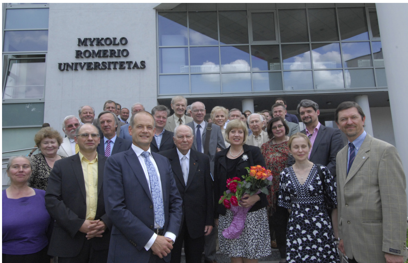
MRU Adolfo Damušio centro atidarymas.