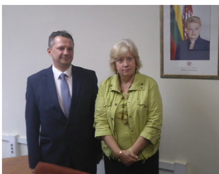
Susitikimas su Ramojumi Kraujaliu, Vyriausioju Lietuvos archyvaru.